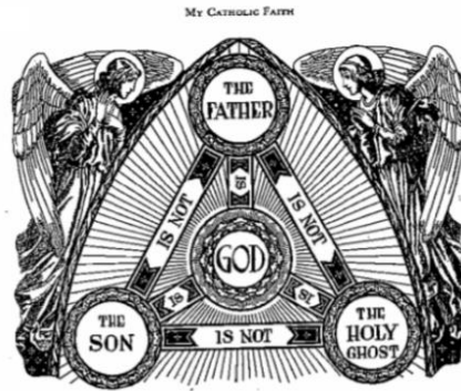
Trinidad Católica 2

22- Señor, ahora veo que la Trinidad es una falsa enseñanza que se opone a las escrituras. ¿Qué debo hacer?